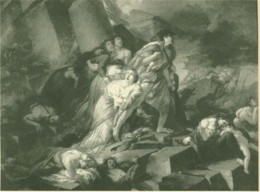
Istanbul'da bir deprem anı

besi çöktü. Tahribat oldukça büyüktü; İmparator II. Basileios'un başlattığı Ayasofya Kilisesi'nin tamirati ancak 6 yılda bitirilebildi 51 .